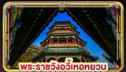
พระราชวังอวิหะทยวน