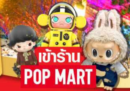
★ เข้าร้าน POP MART