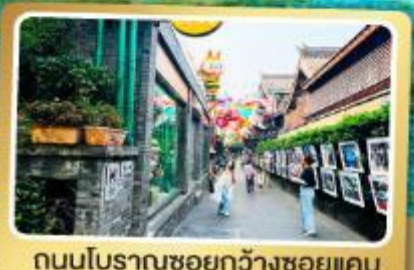
ถนนโบราณชอยกวางชอยแคบ