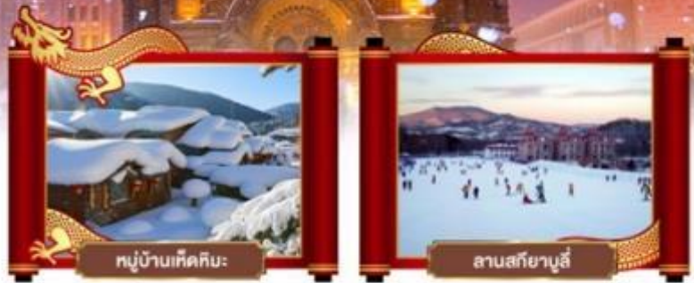
หมู่บ้านหิมะหิมะ

• มหัศจรรย์ดินแดนกุหลาบ หมู่บ้านหิมะแห่งความฝัน