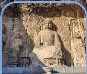
ถ้ำแกะสลักพาสินหลงเหมิน