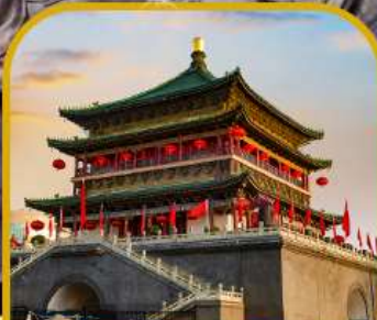
จัตุรัสหอกลอง หอระฆัง