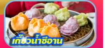
เกี๊ยวน้ำซีอาน