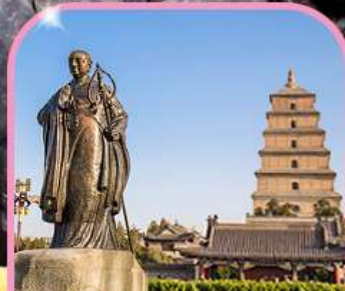
เจดีย์ห่านป่าใหญ่