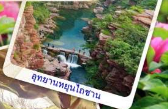
อุทยานหยุนโถซาน