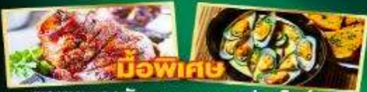
หมูพะเนาะ พาหมูเยอรมัน หอยแมลงภู่อบไวน์ขาว