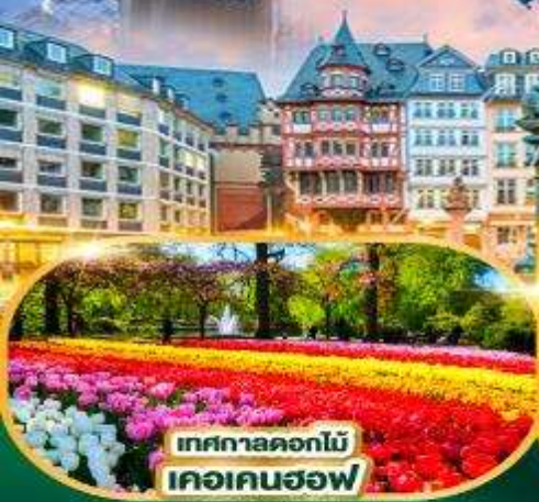
เทศกาลดอกไม้ เคอเคนฮอฟ