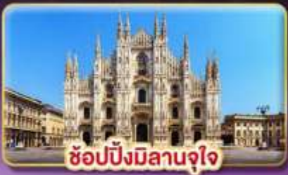
ช้อปปิ้งมิลานจุใจ

ที่สุดของธรรมชาติ "ยุโรป" แช่น้ำแร่ วิวดอกอัลการ์