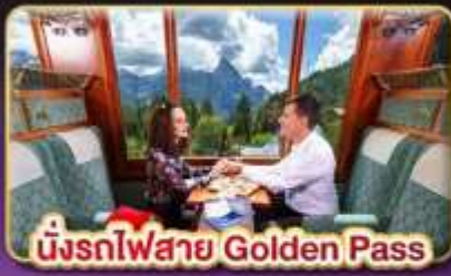
นั่งรถไฟสาย Golden Pass