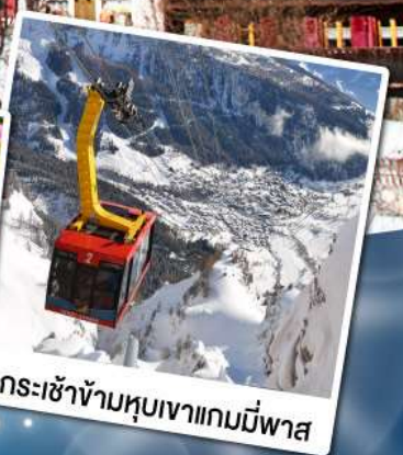
กระเช้าข้ามหุบเขาแกมมีพาส