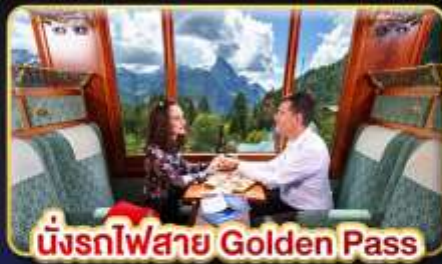
นั่งรถไฟสาย Golden Pass