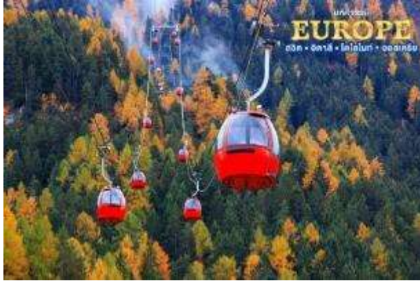
นำท่านนั่งกระเช้าลงที่สถานี Seis am Schlern

📍 บริการอาหารเช้า ณ ห้องอาหารของโรงแรม (มื้อที่5)