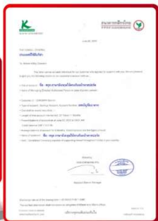
ตัวอย่าง Bank Guarantee ที่ผู้สมัครต้องขอจากธนาคาร