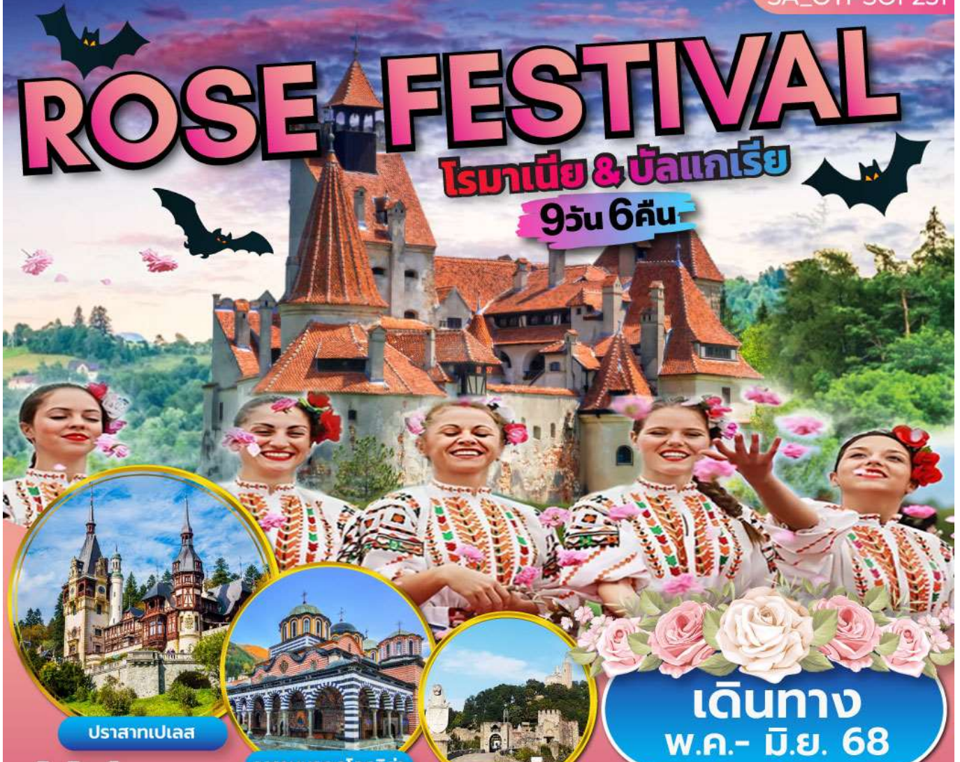
ปราสาทเปเลส