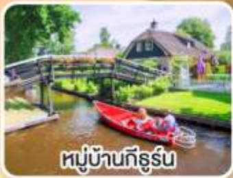
หมู่บ้านทึร์น