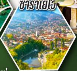
ซาราเยโว

• นั่งกระเช้าสู่ยอดเขาคุบรอฟนิค • ชิมหอยนางรมสดๆ เมืองสตอน