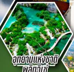
อุทยานแห่งชาติ ฟลิตวิเช