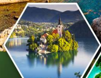
ทะเลสาบพลอด