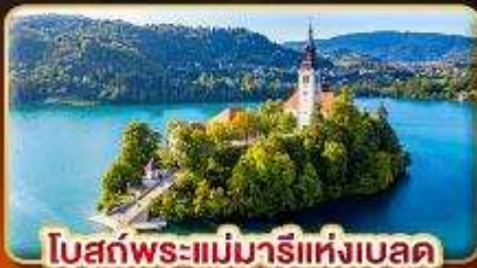
โบสถ์พระแม่มาเรียแห่งเบลด