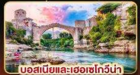
บอสเนียและเฮอร์เซโกวีนา