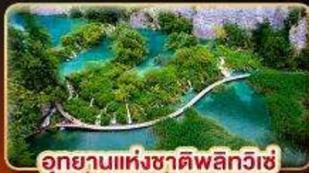
อุทยานแห่งชาติพลิกวิเซ