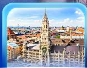
จัตุรัสมาเรียนพลาทซ์

เวียนนา ปราสาทนอยชวาสไตน์ ลูเซิร์น เซอร์แมท ชุก ซูริก