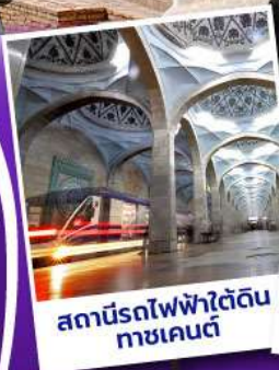
สถานีรถไฟฟ้ายุคใหม่ ทาชเคนต์