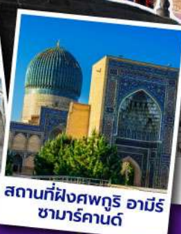
สถานที่ฝังศพกูรี อามิร ซามาร์คานด์