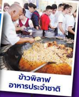
ข้าวพิลอฟ อาหารประจำชาติ